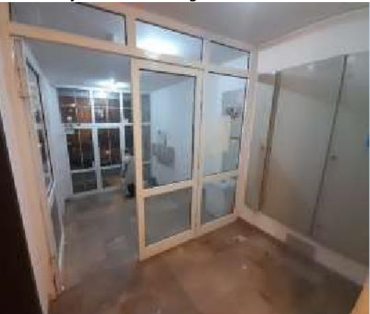
Unutrašnjost stambene zgrade