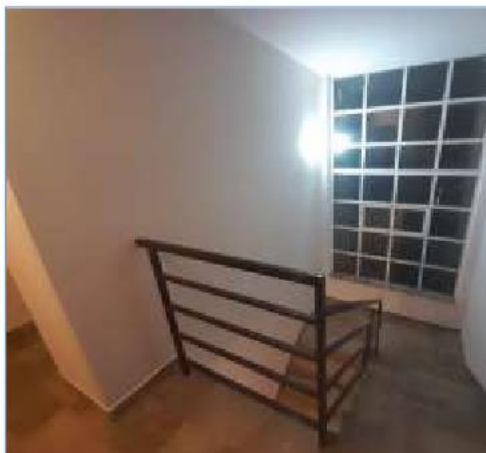
Unutrašnjost četvorosobnog stana br.11